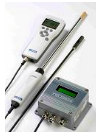
使用HM70对维萨拉公司固定安装变送器进行现场校准。

MI70Link连接软件是一个可选项，主要是将HM70记录的测量数据和实时测量数据上传到计算机。