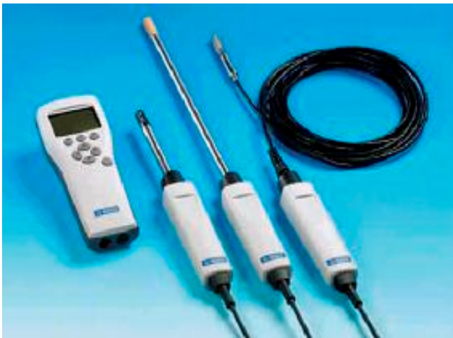
用于现场单点测量的HM70手持式温湿度仪表