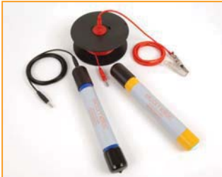
Elcometer 3312 半电池测试包

Elcometer 半电池测试装置： 包括铜/硫酸铜 (Cu/CuSO 4 ) 电极或银/氯化银电极 (Ag/AgCl)。每个半电池都是密封装置，因此不需要在现场配置化学溶液。测试包中带 25m 测试线，每个半电池测试包质保期为 5 年。