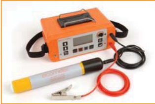
Elcometer 3312 带半电池探头

Elcometer 3312 保护层测试和半电池测试仪不仅可以定位钢筋位置和走向、保护层厚度、和钢筋直径，同时还可以根据半电池法测试钢筋锈蚀情况。