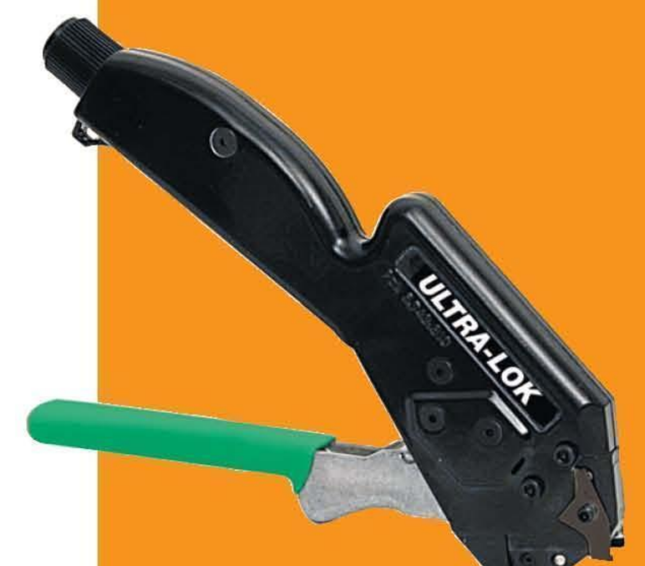
A94079 Ultra-Lok 紧带机