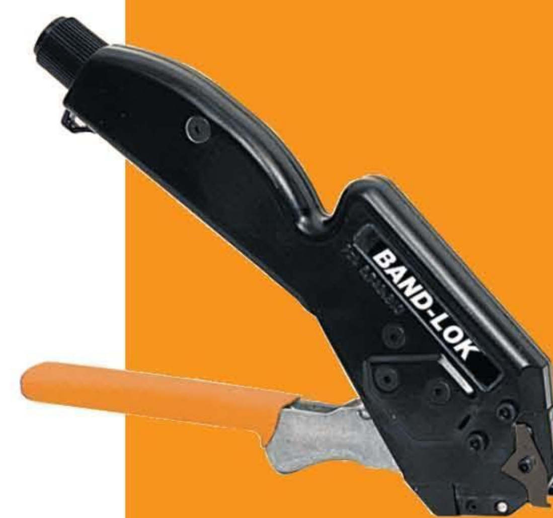
A95079 Band-Lok 紧带机