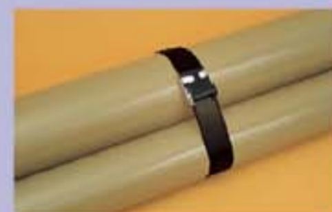
316 型涂层不锈钢扎带