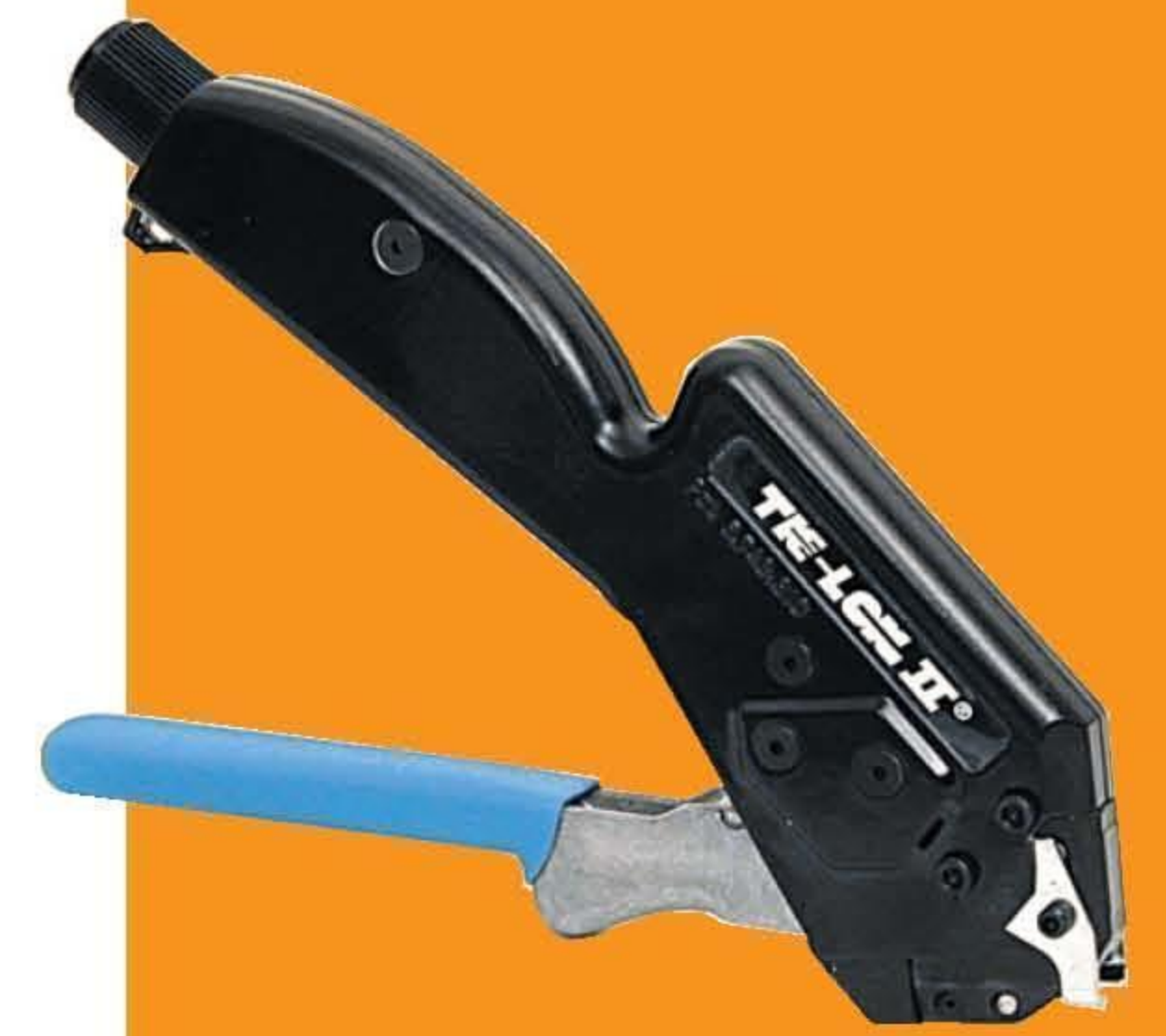
A92079 Tie-Lok II 紧带机