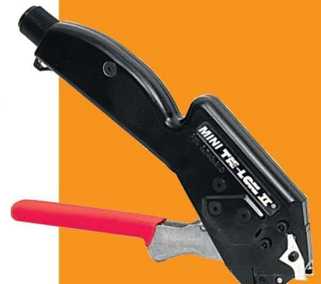
A91079 小型 Tie-Lok II 紧带机