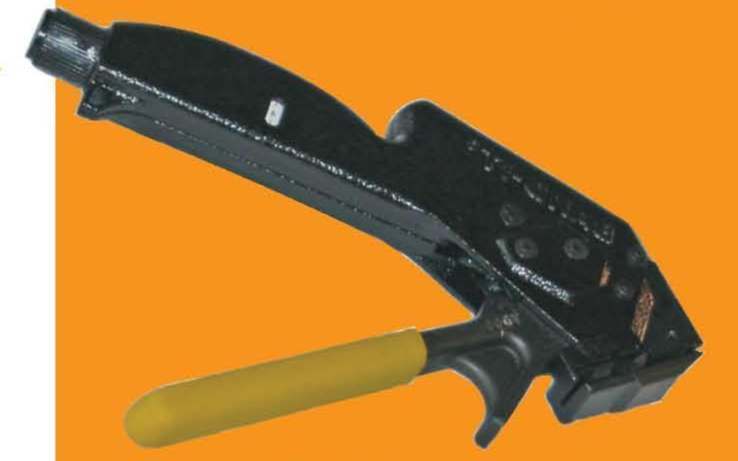
M50389 Multi-Lok 手动紧带机