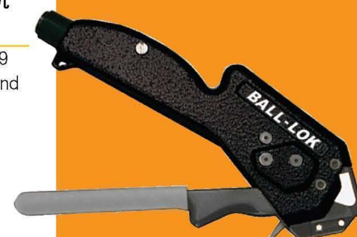
K50289 Ball-Lok 紧带机