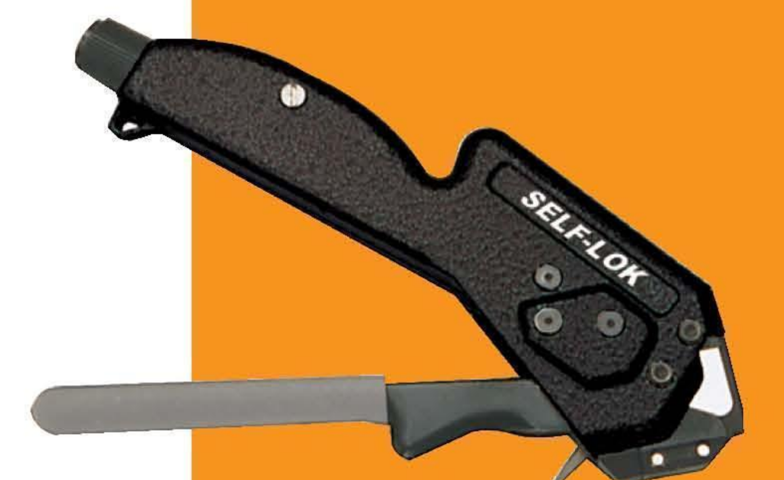
K50289 Ball-Lok™ 或 Self-Lok 手动紧带机