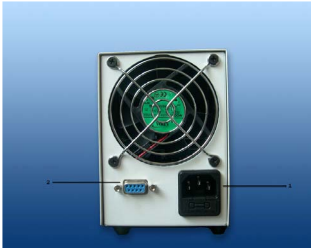
图(一) 1. AC 输入插座 2. 线控插座

如图一所示, 首先确认使用地区的市电电压, 然后确认冷光源所使用的电压是否与之相符, 否则应选择相应的输入电压的冷光源。