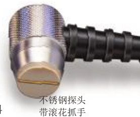
不锈钢探头 带滚花抓手

5 MHz 双偶传感器, 探头端面为聚醚醚酮特种塑料 对于细小工件自动进行V路补偿