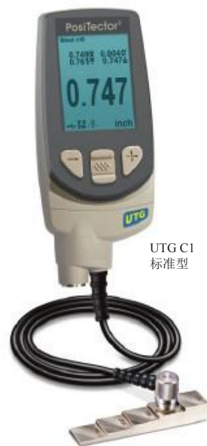
UTG C1 标准型