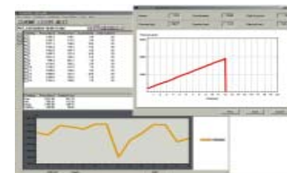
显示压力、速率、测试持续时间、锭子尺寸 计算最大值、最小、平均值和标准偏差 打印和显示图形