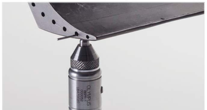
使用目标钢线对涡轮叶片进行测量

目标钢线可被插入到涡轮叶片的冷却孔中，而较大的磁性目标钢珠可用于测量最厚达25.4毫米的喷气式引擎部件。