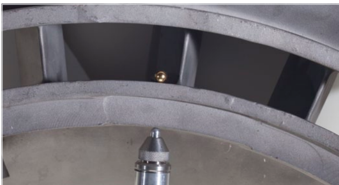
对24.1毫米的航天器铸件进行测量

Magna-Mike已被成功地应用于航空航天领域的质量控制程序中，对由复合材料及非铁性材料制成的航空航天器的各个部件进行测量。