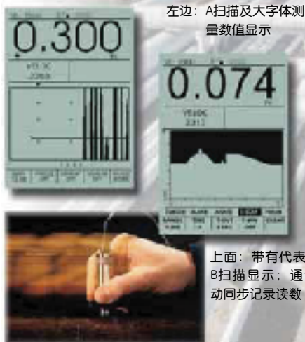
左边：A扫描及大字体测量数值显示