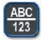
“虚拟键盘” —方便灵活地使用ABC键