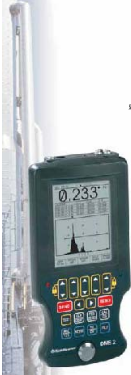
显示涂层和材料厚度的A扫描图

如果你的零件没有涂层，你可以使用Auto-V功能，它简化了传统的厚度测量，是一种独特的方法。利用Auto-V能让你在不知道材料声速时也能测量零件厚度。在测量没有涂层的不同材料时无需校准，也不用任何校准试块。不用知道材料的声速就能测量—这样将以前的缺点一扫而光!