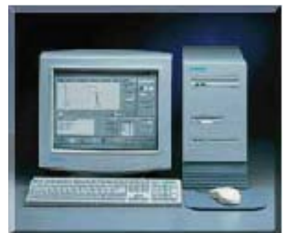
带有应用软件的DMS 2系列数据管理系统能对数据和文件进行传输及管理