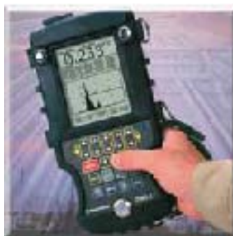
可插入测量读数的微型栅格功能