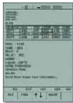
文件快速方便的导航功能