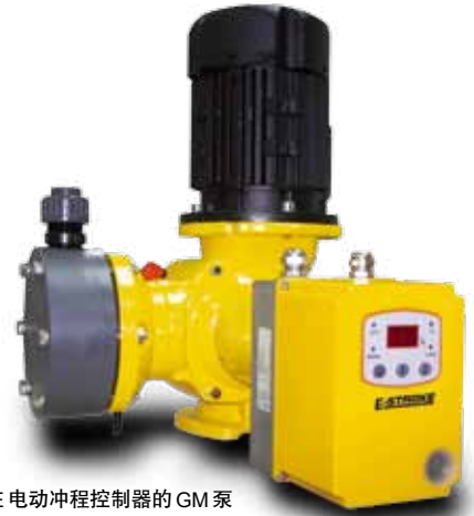
带 E-STROKE 电动冲程控制器的 GM 泵