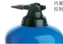
内置旁路开关: 转换控制浓缩液注入和停止的装置。

提供的选项是为了能够满足您对Dosatron的需要。请与我们的技术服务部门联系, 以便帮助确定您可能需要的选项。