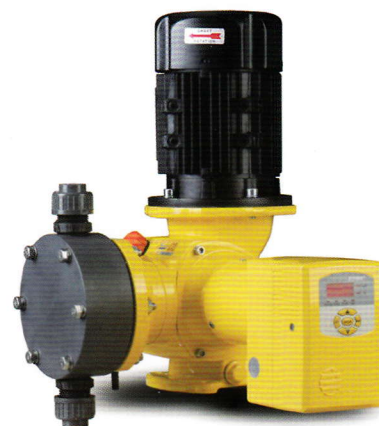
带 E-STROKE 电动冲程控制器的 GM 泵