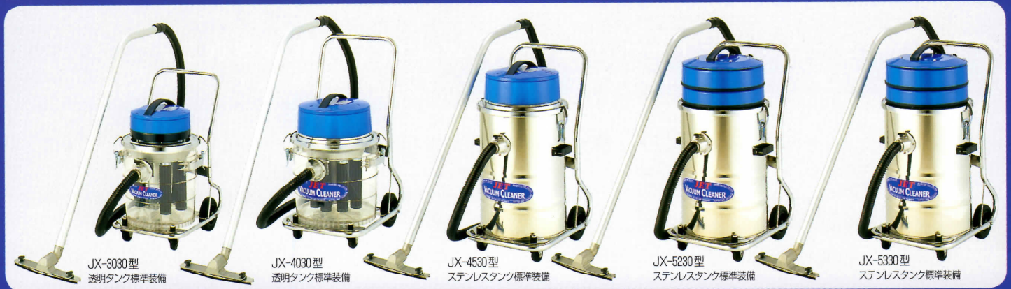
JX-3030型 透明タンク標準装備