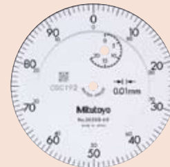
2050S-60 2050S 2050S-19