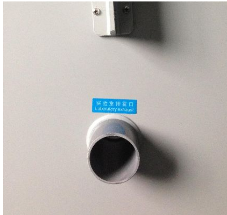
（排霧口，請務必按要求接至室外）

鹽霧機排霧管是一個非常重要的部位，請務必將我司配備的排霧管連接至室外，或者自行準備合適的排霧管亦可（非金屬材質），排霧口直徑為 50mm，安裝時需平行或者下行安裝，請勿盤繞或 U 形管路安裝，這樣可能會導致鹽霧無法排除，從而影響試驗效果。