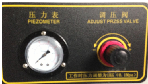
（正面調壓閥及壓力錶，內圈壓力調至數字 1）

噴霧壓力維持在 1\text{kg}/\text{cm}^2 ，也就是正面調壓閥壓力（必須在噴霧狀態壓力才會顯示），壓力錶如圖所示：