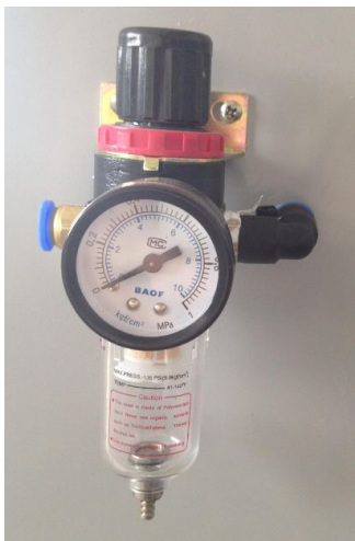
（背部壓力錶，內圈壓力調節至數字 2）

準備一臺功率為 2.2KW（3HP）以上的空氣壓縮機，外接直徑 8mm 氣管，插入鹽霧機背部調壓閥快速接頭。並觀察背部調壓閥氣壓，保證壓力在 2\text{kg}/\text{cm}^2 。如果條件允許，請外接一個油水分離器，以保證氣源的純淨。