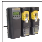
与 MicroDock II 兼容