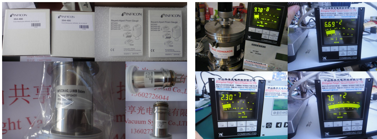
Inficon BPG400 sensor 中山共享光电专业代理各类真空计

中山共享光电会对维修后的各类真空泵，分子泵进行真空测量，同时为客户提供真空较准工作。