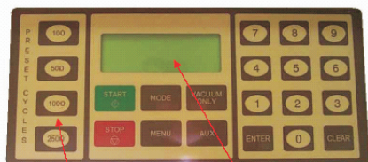
预先设定速度按钮