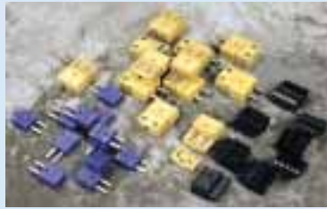
各种温度探头连接插件 2382 热阻连接件 2381 普通型热偶连接插件 2380 迷你型各种连接插件