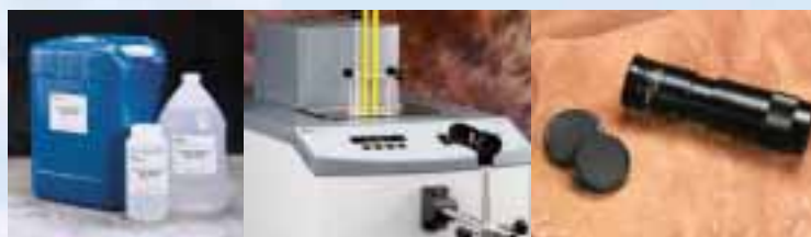
液体介质 5012-18.9L 5017-18.9L