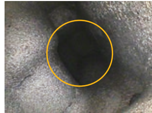
前一型号 (IPEX UltraLite)