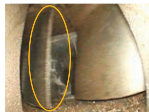
前一型号 (IPEX UltraLite)