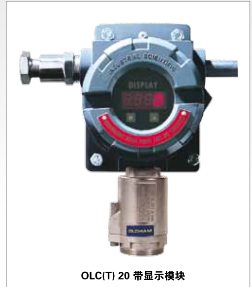
OLC(T) 20 带显示模块