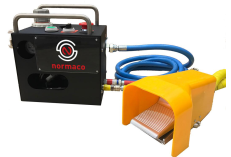
空气安全处理装置（带脚踏开关）