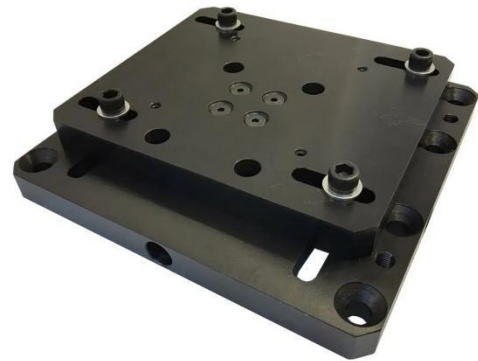
钻机安装可调节底座板