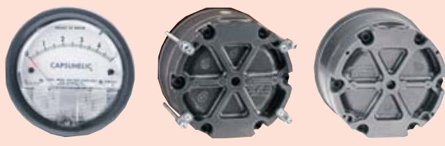
表盘上的嵌入式安装 背面图，带嵌入式安装附件 表面安装的背面图

Capsuhelic® 压力表可嵌入式安装或表面安装，两者的安装部件都附带。嵌入式安装需要开一个 4 1/8" 的孔。对有高冲击和高震动问题的应用场合，可选用 A-496 加强型嵌入式安装支架。使用 A-610 套件可以安装到 1 1/2"-2" 的水平或垂直管道上。安装过程与第 5 页显示的 Magnehelic® 差压表相同。所有标准型号都已经校准为垂直安装型的。在特殊定单下，对量程大于 5in.w.c. 的差压表可在制造厂内校准为水平安装型的或倾斜安装型的。