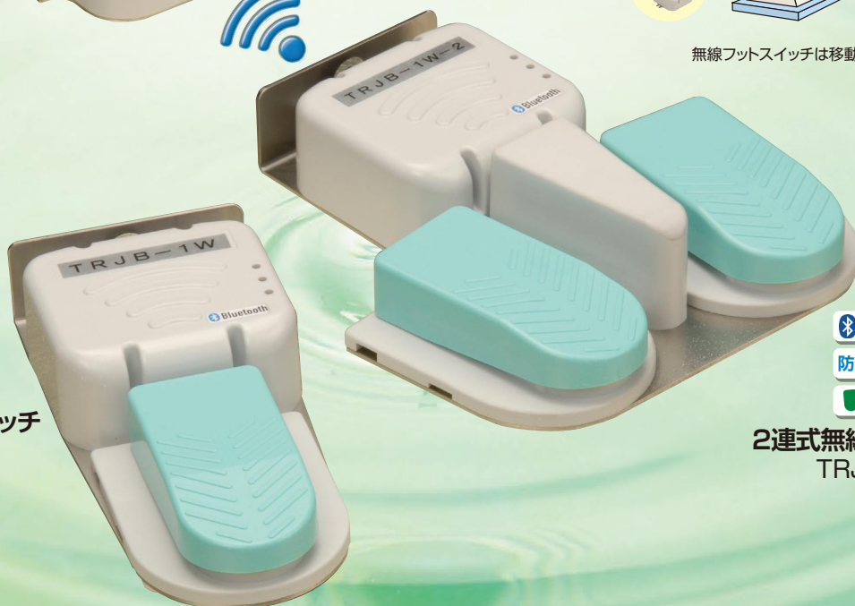
Bluetooth 防水IPX8 相当 無線フットスイッチ TRJB-1W