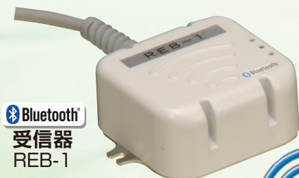
Bluetooth 受信器 REB-1