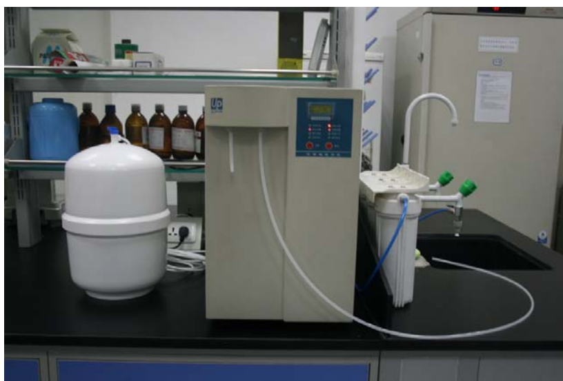
实验室用超纯水机

(6) 原价购我公司生产 实验室超纯水机 MST-I-10 市价 9800.00 直接赠 三星MV800 翻屏相机一部, 市价 1400.00,