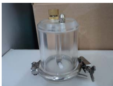
MSC300 超滤杯 ¥2600.00

(2) 原价购MSC300 超滤杯一个享三重大礼 一重礼直接赠送iPod shuffle 一个市场价 ¥380.00, 二重礼声湃思S020 音箱一个市价 89.00, 三重礼加购一盒超滤膜送蜗牛风扇 一个, 图片见第3页, 三重大礼重磅冲击!!!